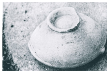
Photo 5 - Poterie sur le site du Bouin