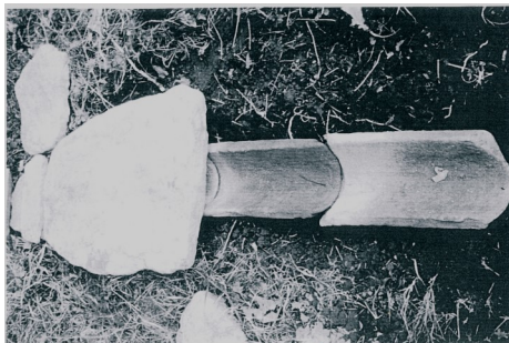
Photo 8 - Eléments du drainage de l'aqueduc de la Jourdanie

(Ces éléments recueillis sont actuellement déposés à la mairie de Pageas et méritent d'être mis en valeur)